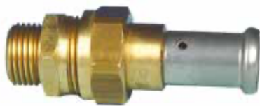
Raccord union à joint plat