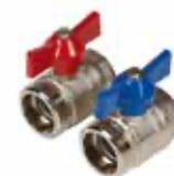
Vanne à sphère et joint, nickelé