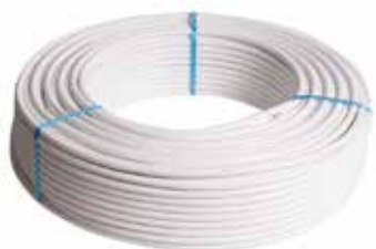
Henco tube multicouche (Rouleau)