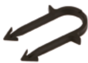
Agrafe tacker, 60mm