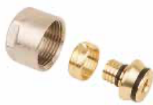
Raccord à visser eurocone (3/4"F)