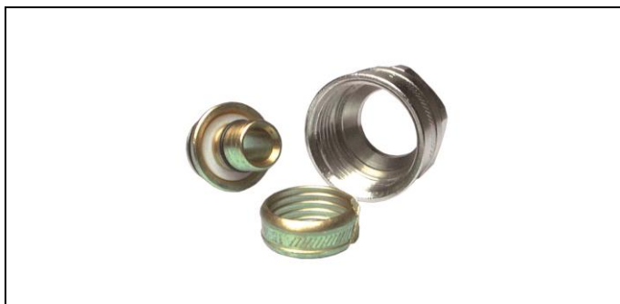
Fig. 2: Koppeling

De verschillende koppelstukken, verenigbaar met het Euroconus gamma, worden in de Henco Schroef prijslijst vermeld.