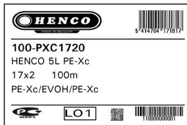
Fig. 1 Étiquette

Le marquage est apposé sur l'emballage au moyen d'une étiquette. Le marquage se présente comme suit (exemple de PE-Xc 17x2) :