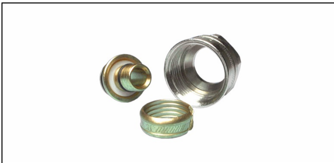
Fig. 2 Raccord

Les différents raccords, compatibles avec la gamme Euroconus, sont mentionnés sur la liste de prix Henco Schroef.