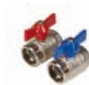
UFH-B0605-VN (conexión 3/4" x 1")