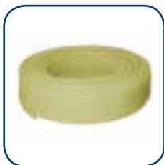
Henco 1L PEXc