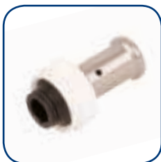
19PK Ø 16-20