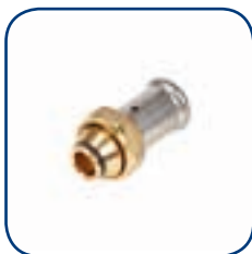
19P Ø 16-20