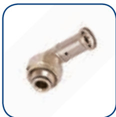
33P Ø 16

Para realizar la instalación Ecoline tiene que tener una bomba de circulación y una válvula termostática de equilibrado (no incluida en la gama Henco)