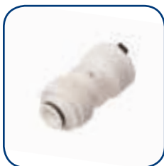
19SK Ø 16-20