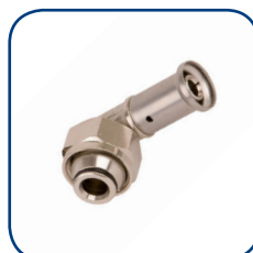
33P Ø 16

Artikels om de Henco Ecoline installatie te vervolledigen: een circulatiepomp en thermostatisch circulatieventiel (behoort niet tot het Henco gamma)