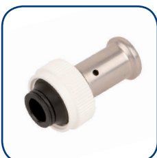
19PK Ø 16-20