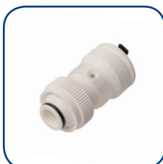
19SK Ø 16-20