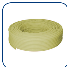
Henco 1L PEXc