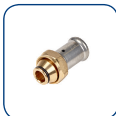
19P Ø 16-20